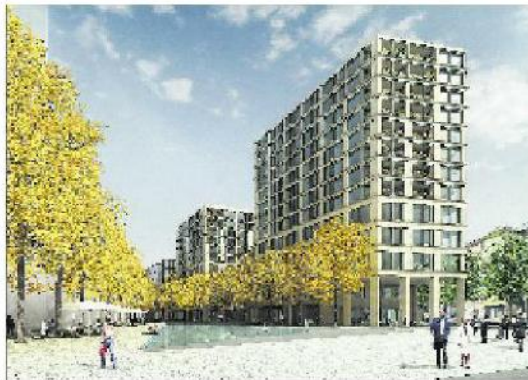
Die künftige Europaallee mit dem Le-Corbusier-Platz zur Sihl hin (links) und dem Gustav-Gull-Platz am anderen Ende.