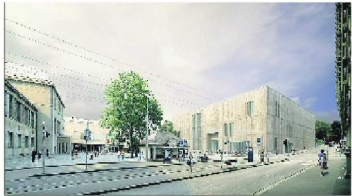
Kunsthäuserweiterung à la Chipperfield am Heimplatz.