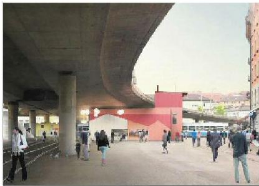
Escher-Wyss-Platz mit geplantem «Nagelhaus».