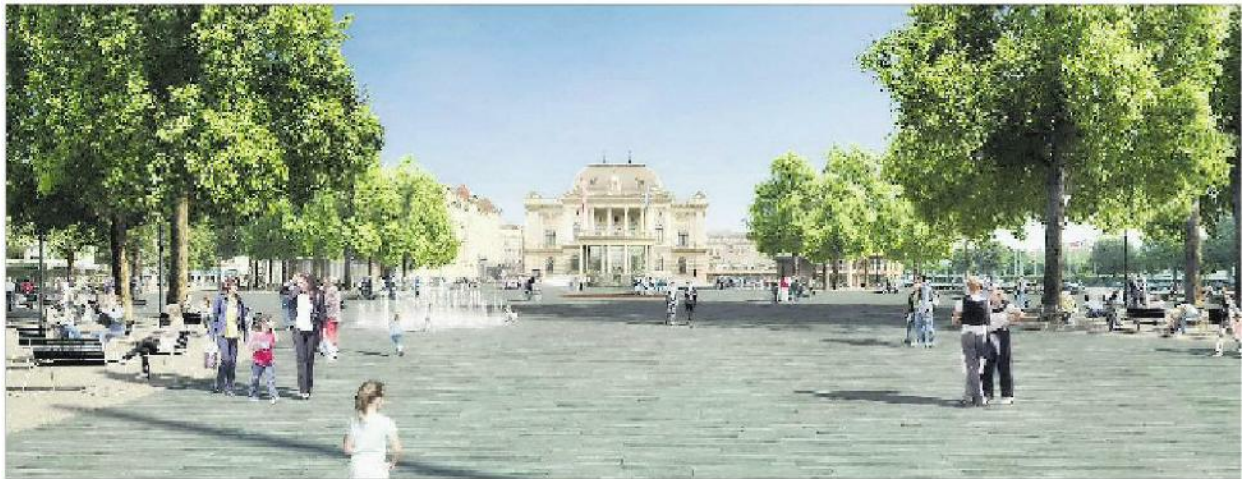
Der Sechseläutenplatz in der Visualisierung: Quarzit-Platten statt Erde und eine Stahlplatte fürs Böög-Feuer.