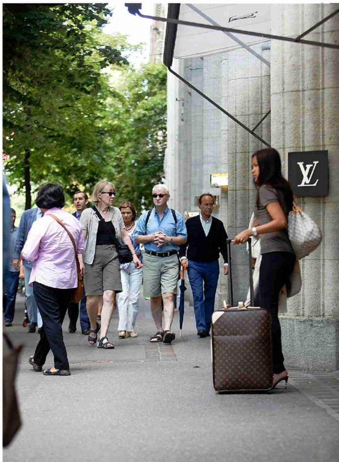
Internationales Shopping an der Bahnhofstrasse.

www.kalkbreite.net www.marktlagerstrasse.ch