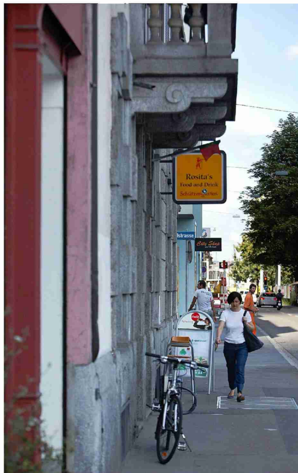
Lokales Einkaufen an der Lagerstrasse.