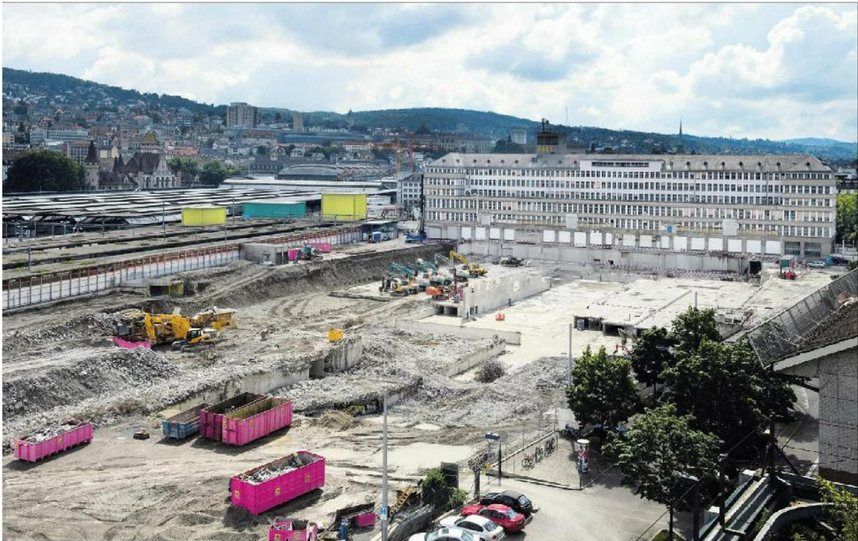
Heute klappt eine gewaltige Baulücke neben der Zürcher Sihlpost. Künftig soll hier die Europaallee entstehen.