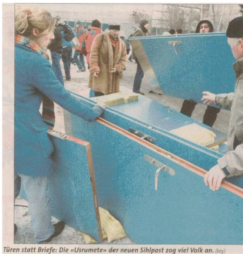
Türen statt Briefe: Die «Usumete» der neuen Sihlpost zog viel Volk an. (key)