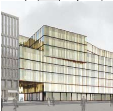
C UBS Retail/Gastro: ca. 1100m 2 Dienstleistung: 32 000 m 2 , vermietet Bezug: 2012