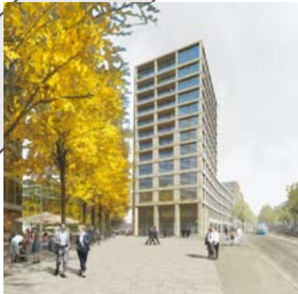
E Retail/Gastro: ca. 1400 m 2 Dienstleistung: ca. 10 000 m 2 , vermietet (Swisscanto, 8500 m 2 ) Mietwohnungen: ca. 6800 m 2 / ca. 64 Wohnungen Bezug: 2014